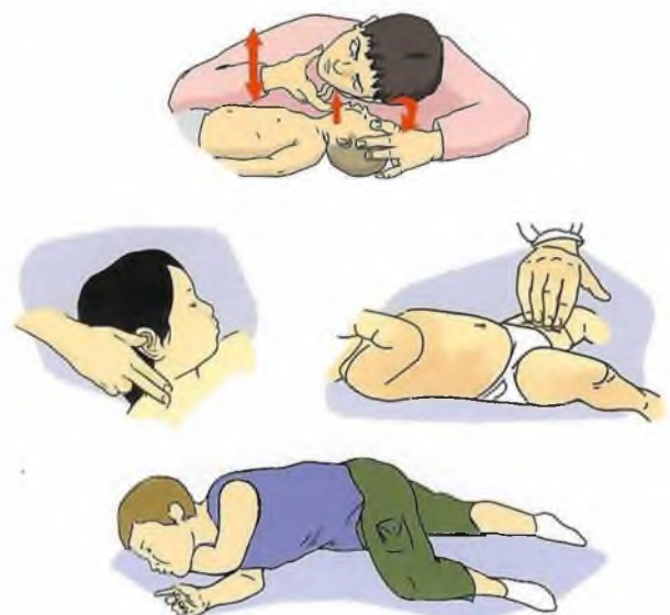
Устойчивое боковое положение